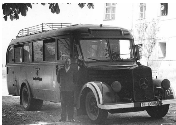
Autobus destinato al trasferimento di disabili da uccidere nel castello di Hartheim

Il castello, detto Schloss Hartheim , fu costruito da Jakob von Aspen nel 1600. È un castello di dimensioni piuttosto ridotte e nelle sue vicinanze si trovano strutture simili. Nel