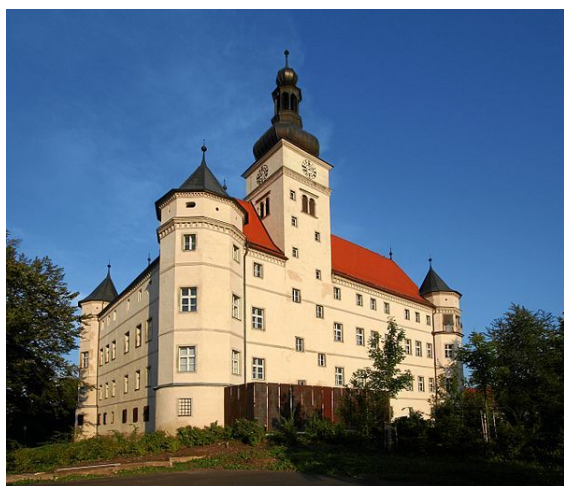
Castello di Hartheim.

Coordinate: 48°16′52″N 14°06′50″E ﻿ / ﻿ 48.281111°N 14.113889°E ﻿ / 48.281111; 14.113889