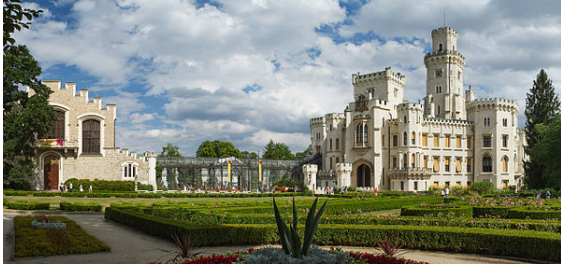
Il complesso del castello